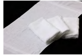
□23 タオル 4枚